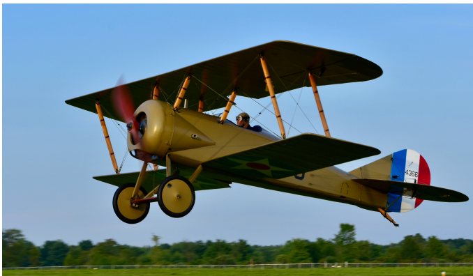
Photograph of Tommy's Centennial Flight over Tompkins County on September 29th 2018.

Uno de los pocos aviones sobrevivientes fue donado a la Fundación del Patrimonio de Aviación de Ithaca en 2010. Después de catorce años de búsqueda, replicación y restauración, este avión Tommy despegó del Aeropuerto de Ithaca en septiembre de 2018; cien años después de ser construido. Tommy voló por más de treinta minutos sobre Tompkins County. Este avión Tommy ahora está en préstamo permanente de la Fundación del Patrimonio de Aviación de Ithaca para ser exhibido en El Centro de Historia en Tompkins County en Ithaca, NY.